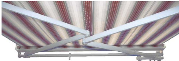
Solstar 40 DSX

Bei der DSX-Ausführung wird auf der Antriebsseite unterhalb des Tragrohres ein zusätzlicher Träger für das Stellager montiert. Somit können sich beide Gelenkarme überkreuzen und ein im Verhältnis zur Breite größerer Markisenausfall erreicht werden. Damit der Höhenunterschied der Arme von außen nicht auffällt beträgt die Volanthöhe bei der DSX-Ausführung 25 cm.