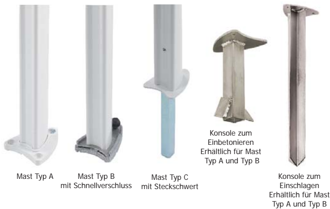
Mast Typ A